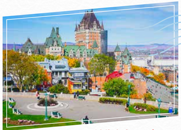
魁北克市 Quebec City

清晨由多倫多出發，乘坐豪華旅遊巴士前往北美八大奇景之一的著名“千島風景區”及風景如畫的聖勞倫斯國家公園。並乘坐大型豪華遊輪（自費），遊覽著名的“千島風景區”，觀賞位於美加邊境的聖勞倫斯河上星羅棋佈的私人島嶼避暑勝地，近觀在20世紀初斥巨資打造的心形愛情島，傾聽充滿浪漫和傷感的富豪愛情故事，環顧世界最短的國際橋等秀麗景色。