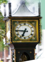
煤氣鎮 - 蒸氣鐘

Morning commence Vancouver city tour to Chinatown, Gastown and Stanley Park. Early afternoon proceed to Canada Place, Flyover Canada (admission not included), Seawall water walk, Winter Olympic Park, Capilano Suspension Bridge (admission not included), Queen Elizabeth Park.