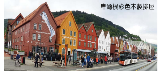
卑爾根彩色木製排屋

自助式早餐後驅車前往挪威峽灣之都~卑爾根，安排穿越哈丹哥大橋橫過挪威最幽靜美麗之哈丹哥峽灣，它在挪威四大峽灣中為最平緩，有著田園牧歌般的美麗風光。抵達後前往卑爾根獨有的彩色木製排屋 (1979年被聯合國教科文組織列入為世界遺