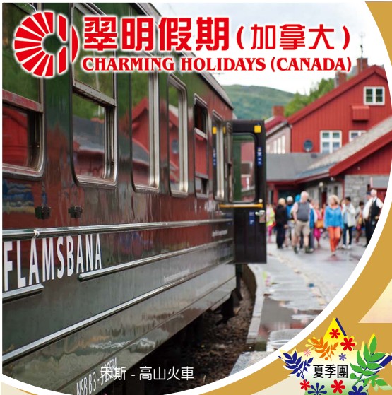
禾斯 - 高山火車