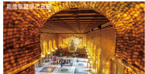
斯德歌爾摩市政廳

自助式早餐後，首先前往參觀著名的市政廳。每年十二月頒發的諾貝爾獎儀式結束後，都會在市政廳內的藍廳安排晚宴。而晚宴後會在金殿內舉行盛大而隆重的宴會。遊畢前往參觀著名之華沙號戰船博物館。華沙號戰船由於設計出錯，上重下輕，在下水禮時沉沒，20 世紀初經打撈及修復後，到今日再次展示人前。午餐自備。繼而驅車前往舊城區遊覽，舊城區內縱橫交錯的街道，滿是售賣紀念品的商店，團友可自由瀏覽及購物。稍後專車送往碼頭，