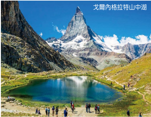
戈爾內格拉特山中湖

* 上列費用均以加幣每位計算，稅金及「燃油附加費」，正確數目須於出票日方能作準。 * 成人費用以二人一房，每位計算；小童費用適用於 2-11 歲小孩不佔床。 * 費用如有任何更改，恕不另行通告。